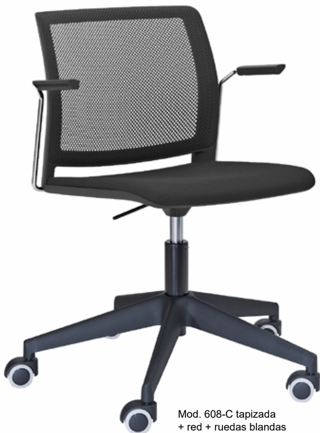
Mod. 608-C tapizada + red + ruedas blandas