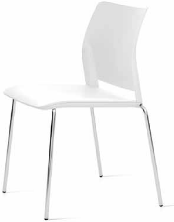
Mod. 600-C plástico

Con brazos o sin brazos es apilable y en el caso de varilla admite 30 sillas sobre un carro.