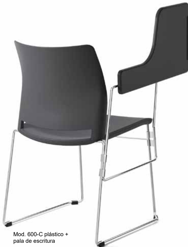
Mod. 600-C plástico + pala de escritura