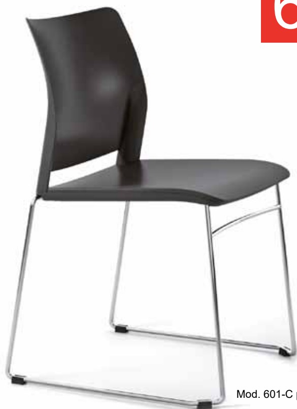
Mod. 601-C plástico

En todas las estructuras de la serie podemos colocar y combinar los tres acabados de asiento: plástico, red o tela autoportante y tapizado clásico: