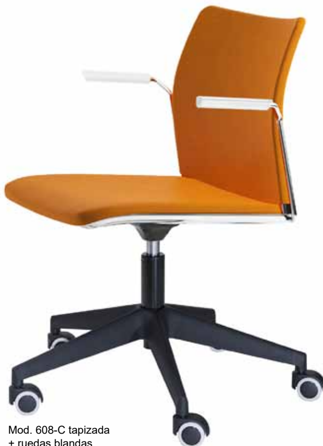
Mod. 608-C tapizada + ruedas blandas