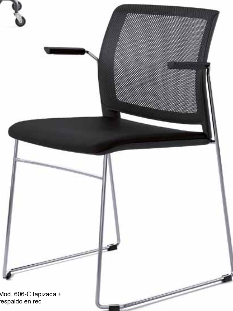
Mod. 606-C tapizada + respaldo en red

5 colores de plástico, 7 de malla, 7 para la tela autoportante y mas 100 telas para la tapicería standar permiten que nuestro cliente elija su colorido ideal.