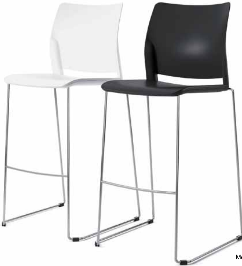
Mod. 609-C plástico