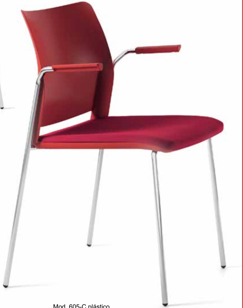
Mod. 605-C plástico