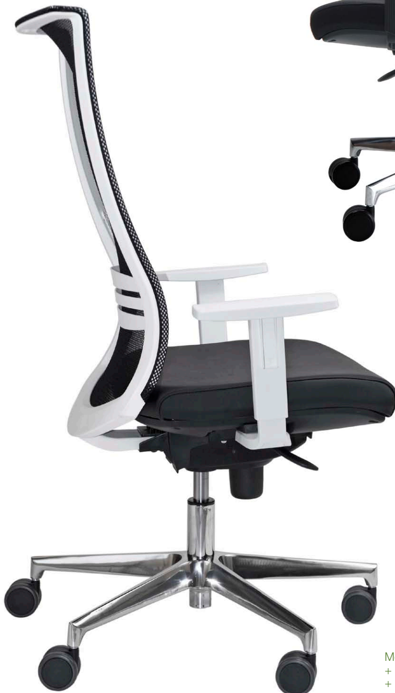
Mod.: 779-B + brazo BR10-B + base BA09 pulida + ruedas blandas

Modelo de silla X-WING, que cumple con la norma EN 1335-1:2009 y con los requisitos de seguridad de EN 1335-2:2009, verificado de acuerdo con EN 1335-3:2009.