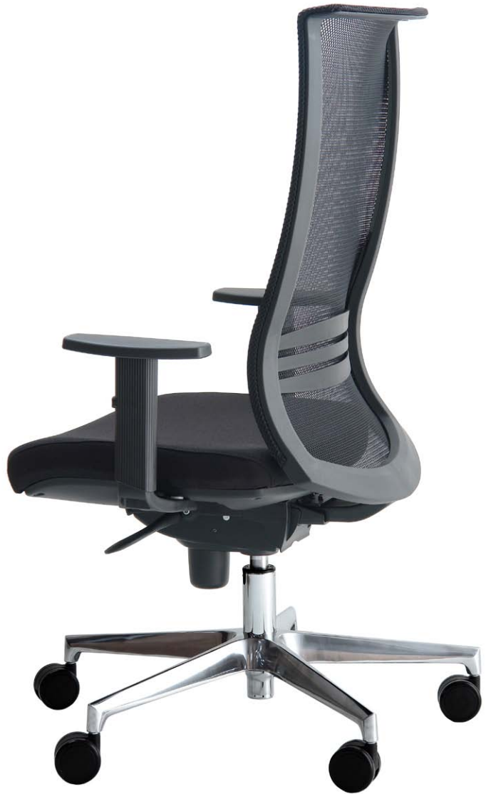
Mod.: 779-N + brazo BR01 + base BA09 pulida