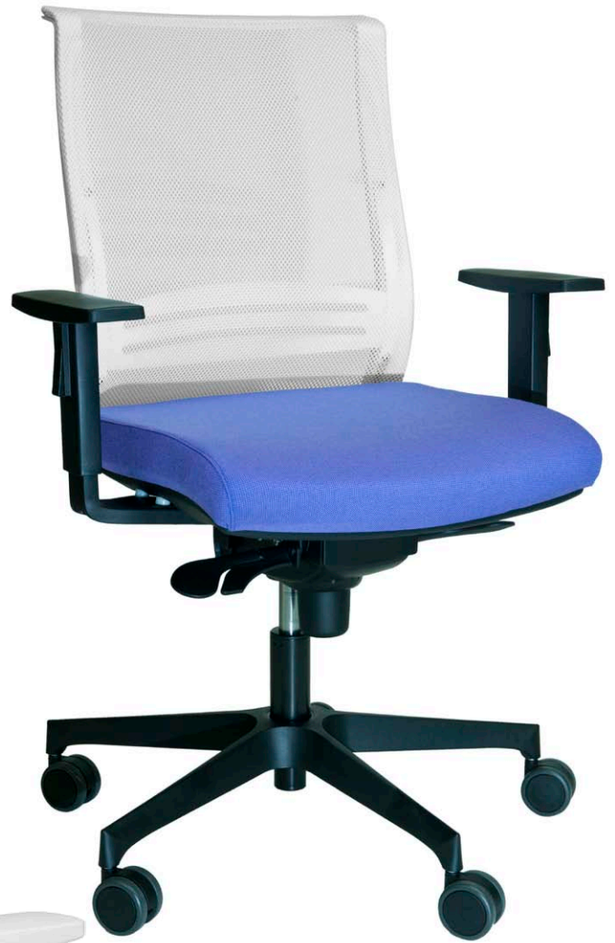
Mod.: 775-N + brazo BR10-N + ruedas blandas