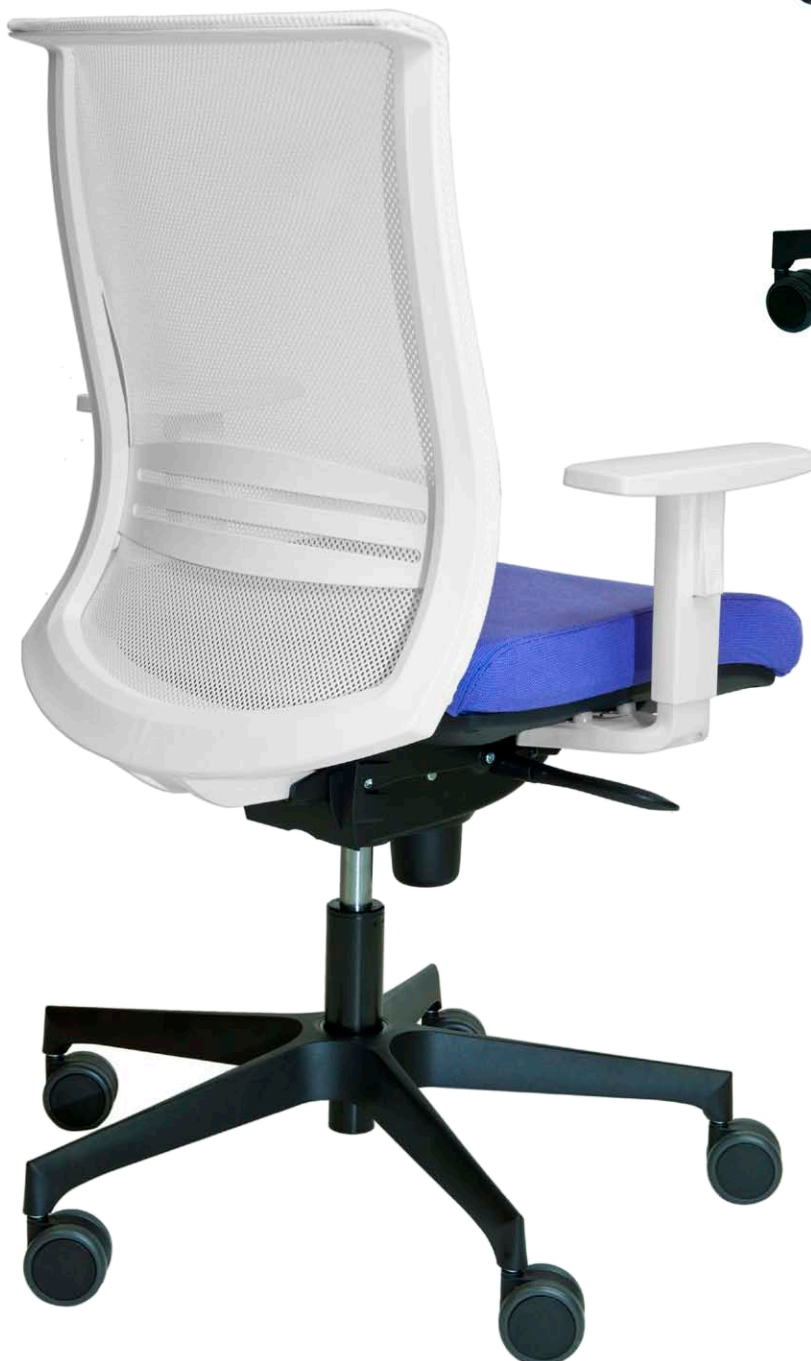
Mod.: 775-N + brazo BR10-B + ruedas blandas

El modelo 775 con respaldo medio, puede incorporar además de los brazos BR06 de la serie X-Wing, el resto de brazos de nuestro catálogo. En este modelo la regulación longitudinal del asiento es opcional y podemos tapizar el respaldo tanto en red como en tela autoportante.